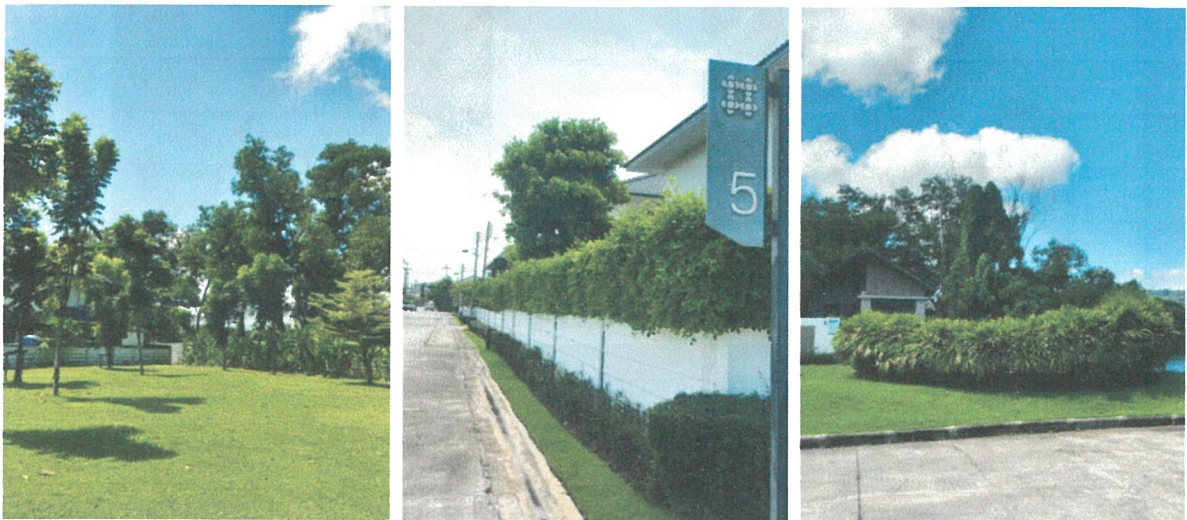
รูปภาพที่ 2.1 พื้นที่สีเขียวภายในโครงการ