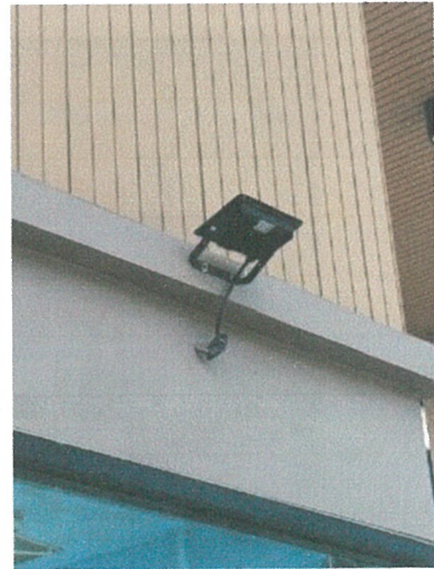
รูปภาพที่ 2.9 ไฟฟ้าส่องสว่างบริเวณทางเข้า-ออก