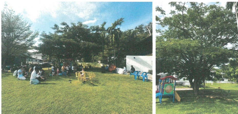
รูปภาพที่ 2.23 พื้นที่จัดรวมพล