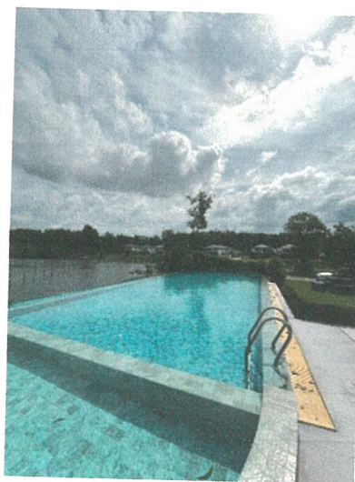
รูปภาพที่ 2.12 สระน้ำของโครงการ