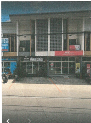
รูปภาพที่ 2.7 เส้นแบ่งช่องสำหรับจอดรถบริเวณหน้าอาคารพาณิชย์