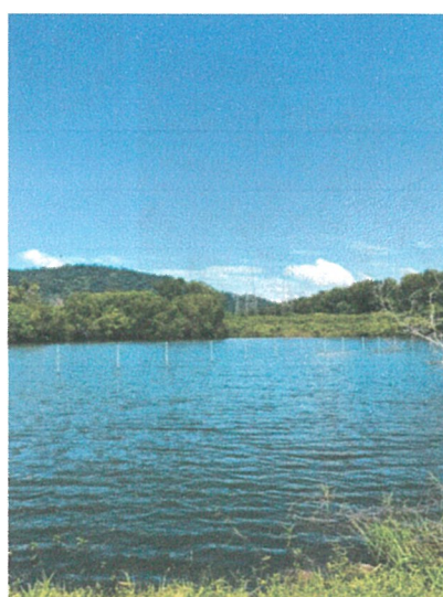
รูปภาพที่ 2.4 เสาตาข่ายกันแนวเขตที่ดิน