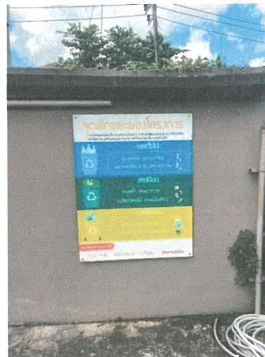
รูปภาพที่ 2.19 ป้ายรณรงค์คัดแยกขยะมูลฝอย