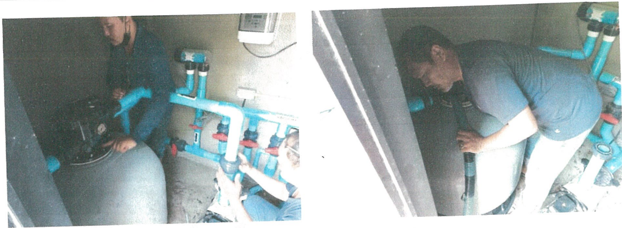
รูปภาพที่ 2.14 การตรวจสอบระบบท่อจ่ายน้ำ