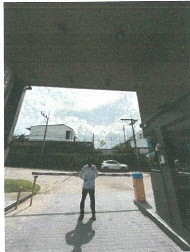
รูปภาพที่ 2.6 เจ้าหน้าที่รักษาความปลอดภัย