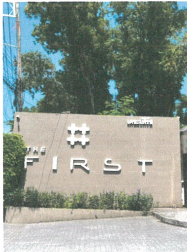
รูปภาพที่ 2.5 ป้ายโครงการ