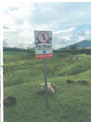
รูปภาพที่ 2.20 ป้ายห้ามทิ้งขยะภายในโครงการ