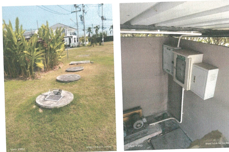
รูปภาพที่ 2.16 ระบบบำบัดน้ำเสีย