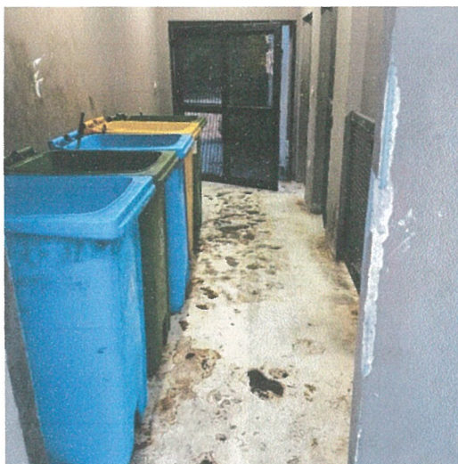
รูปภาพที่ 2.18 ถังขยะแยกประเภท