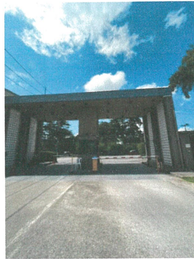
รูปภาพที่ 2.8 ทางเข้า-ออกโครงการ