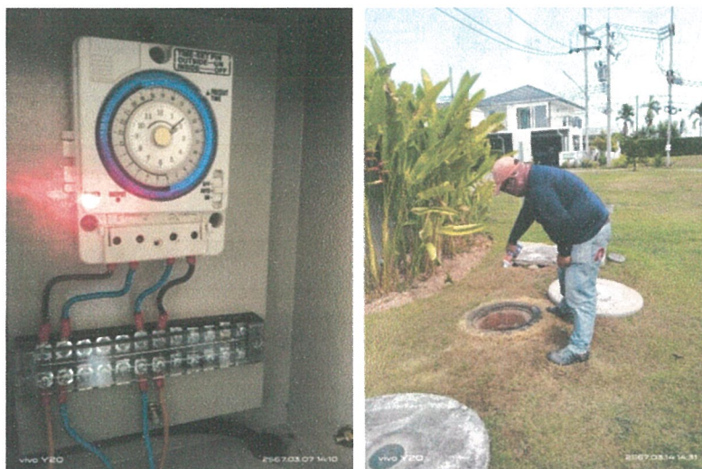
รูปภาพที่ 2.17 การตรวจสอบการทำงานของระบบบำบัดน้ำเสีย