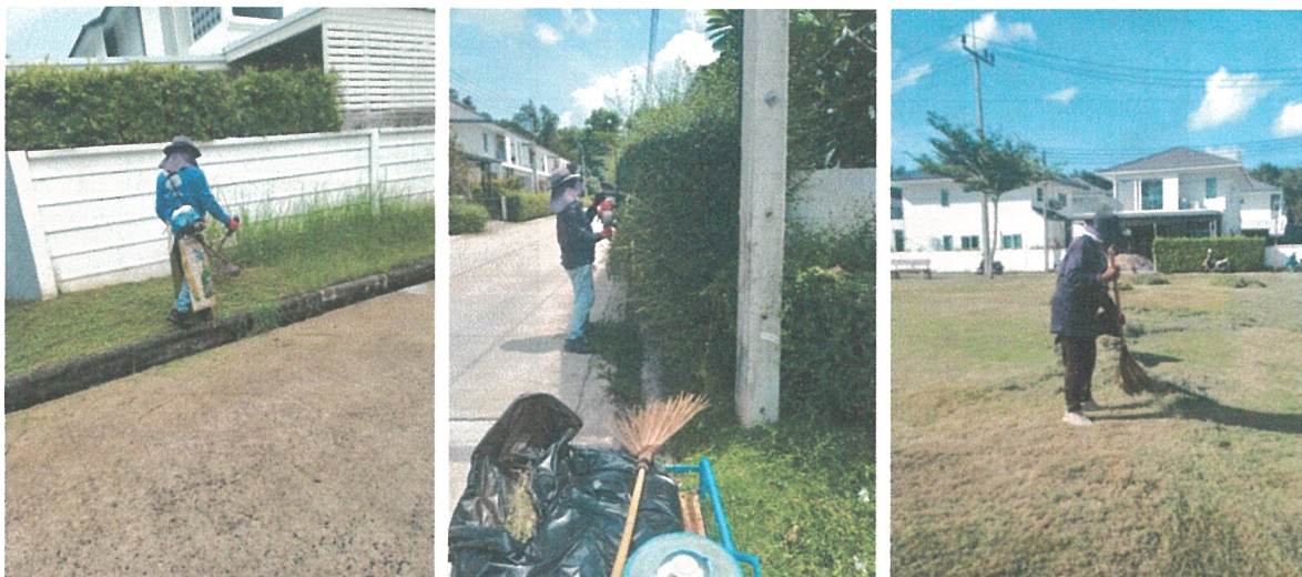
รูปภาพที่ 2.2 งานดูแลสวน