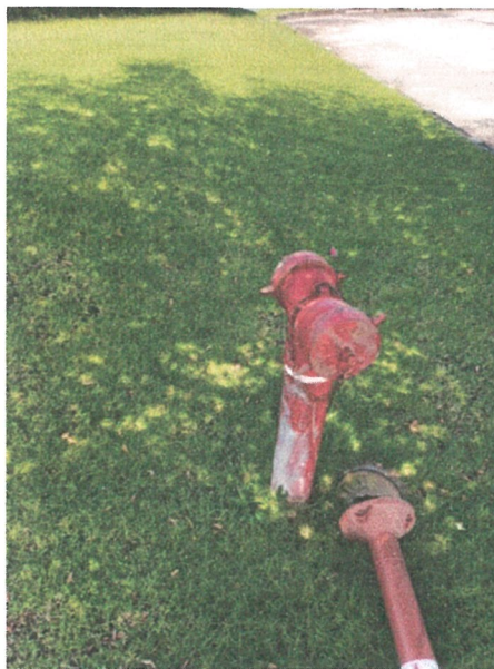
รูปภาพที่ 2.22 หัวรับน้ำดับเพลิง