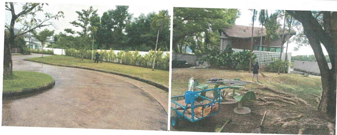
รูปภาพที่ 2.10 การกวาดพื้นถนน