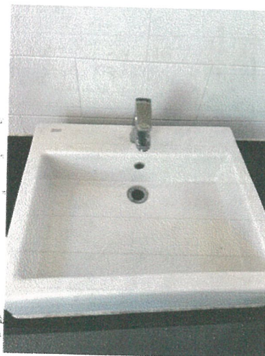
รูปภาพที่ 2.13 สุขภัณฑ์ประหยัdnน้ำ