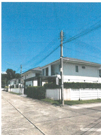
รูปภาพที่ 2.3 สีอาคารของโครงการ