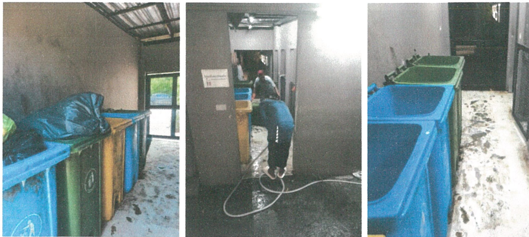
รูปภาพที่ 2.21 การล้างทำความสะอาดห้องพักมูลฝอยรวม