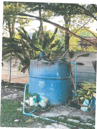
รูปภาพที่ 2.11 ถังเก็บน้ำสำรอง